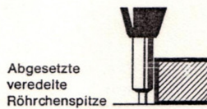
Abgesetzte veredelte Röhrchenspitze